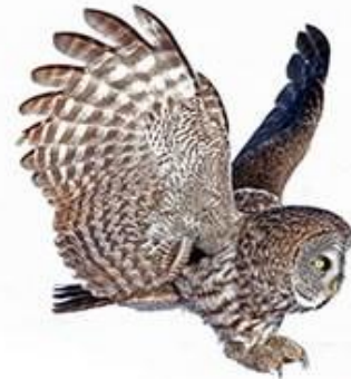
ВА-ВА-ВА К нам летит сова