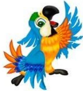
АЙ-АЙ-АЙ Говорящий попугай