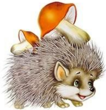
БЫ-БЫ-БЫ Ёж несёт грибы