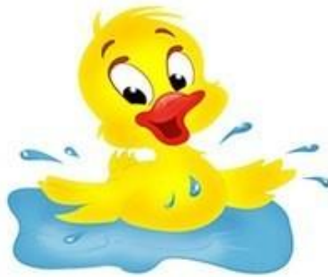
ДЕ-ДЕ-ДЕ Утенок плещется в воде