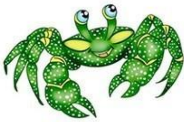
АБ-АБ-АБ Вот большущий краб