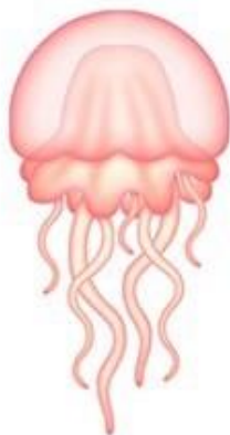
ЗА-ЗА-ЗА Прозрачная медуза