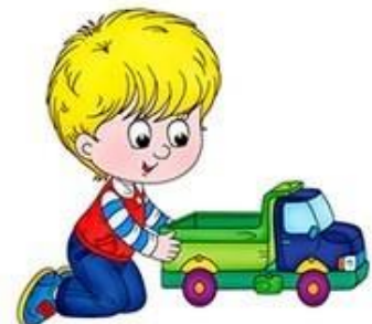
ИК-ИК-ИК Я катаю грузовик