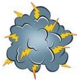
ЗА-ЗА-ЗА Начинается гроза