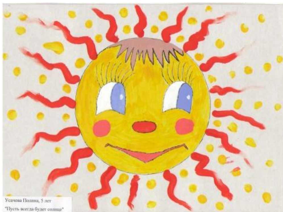
Усачева Полина, 5 лет "Пусть всегда будет солнце"