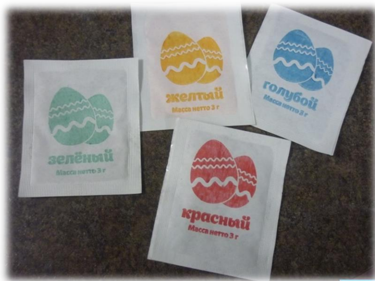
краска для окрашивания пасхальных яиц