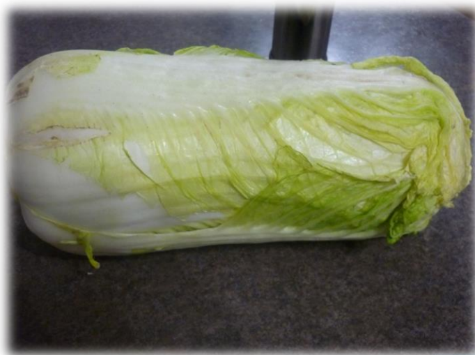
листья пекинской капусты