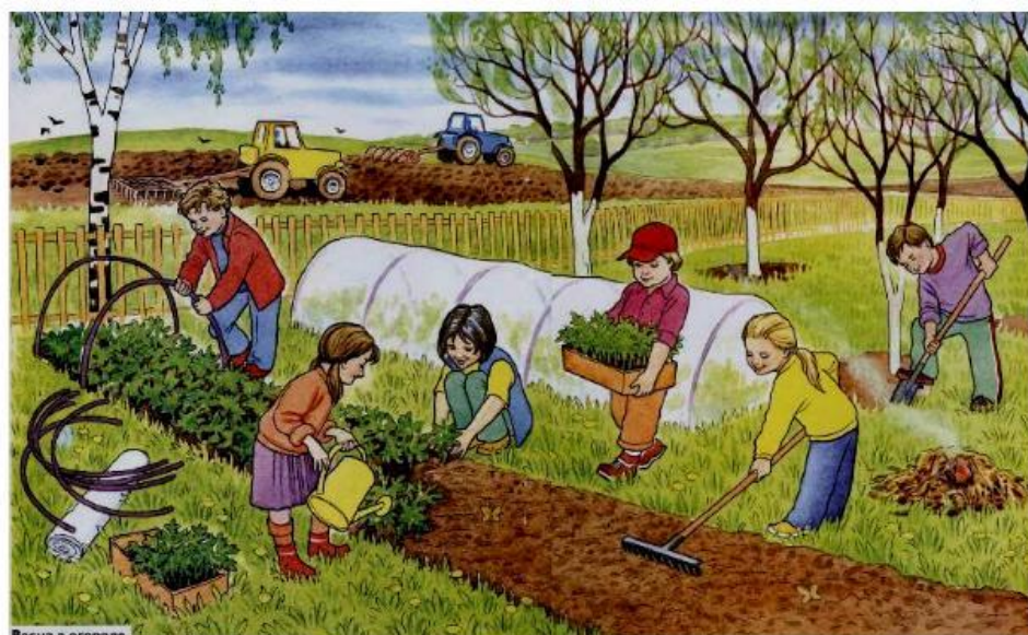
Весна в огороде

Например: Огород - огород - хоровод - садовод - огород - огородить - огород - бутерброд - огород