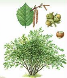
Лещина обыкновенная, или орешник