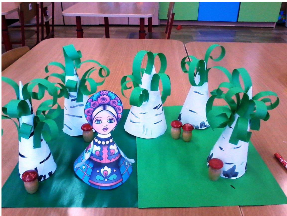
Конструирование и бумаги «Берёзка».